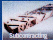
Subcontracting Precision machining