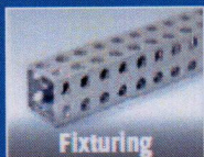
Fixturing Modular Customized